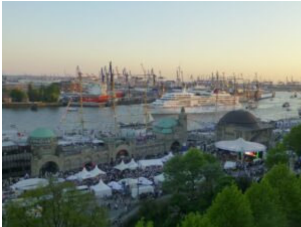
Jedes Jahr im Mai lockt der Hafengeburtstag als maritimes Volksfest Gäste aus dem In- und Ausland nach Hamburg.

Wem bei solch einem vielfältigen Angebot und den ohnehin zahlreichen Sehenswürdigkeiten zwischen Alster und Elbe die (Programm-)auswahl schwerfällt – gerade auch wenn es um Gruppen geht –, kann sich mit den Hamburg-Lotsen durch die Stadt navigieren lassen.