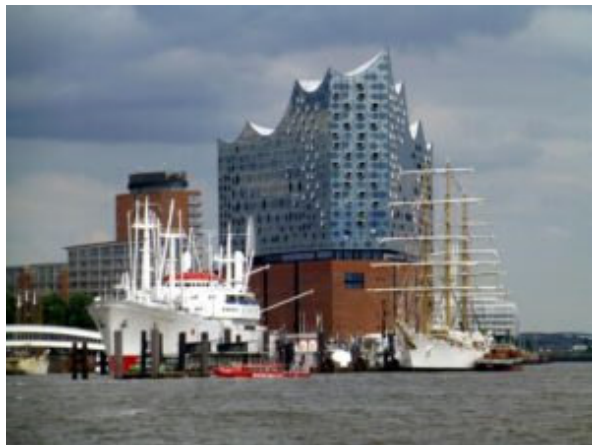
Touristische und kulturelle Anziehungspunkte in Hamburg: Elbphilharmonie, Hamburger Hafen und HafenCity.