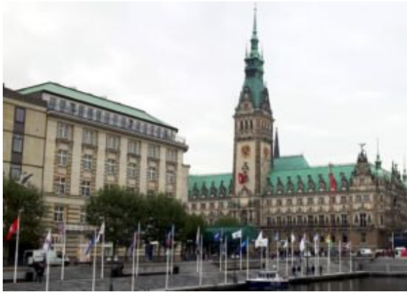
Das Hamburger Rathaus.

Chef-Lotse Schmidt und sein Team aus derzeit 14 ausgebildeten und langjährig erfahrenen Gästeführerinnen und Gästeführern sind spezialisiert auf Stadtführungen und Hamburg-Programme – auch inklusive Organisation, Planung und Durchführung – VIP-Betreuung, Moderation von Events, Bus-, Hafen- und Alsterrundfahrten. Ob für 2 oder 200 Teilnehmende: Die Hamburg-Lotsen gestalten Hamburg-Programme und -Stadtführungen, die auch in verschiedenen Sprachen stattfinden können, nach Wünschen und Anforderungen ganz individuell. „Das fängt schon damit an, dass die Führungen zum Beispiel am Hotel der Teilnehmenden starten und am Restaurant nach Wahl enden können. Vor jeder Führung gibt es eine individuelle Beratung, damit wir unsere Empfehlungen und Toureninhalte an unsere Gäste anpassen können, denn den einen Tipp gibt es nicht“, so der erfahrene Touristiker. „Ob Schulklasse, Verein oder Firma, ob Jugendherberge oder 5-Sterne-Hotel, Fischbrötchenbude oder Sternerestaurant: Wir organisieren im Vorfeld, geben Tipps zu Restaurants, Theater usw. und buchen auf Wunsch alles, was für einen gelungenen Hamburg-Aufenthalt nötig ist.“